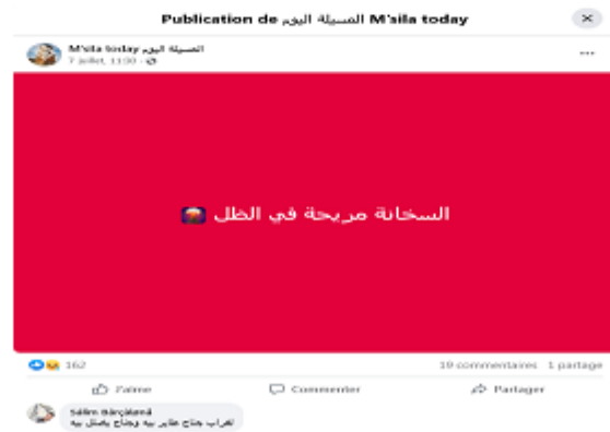
Figure 2 : Publication du 7 juillet 2023.

La rareté des interventions du LC pour corriger et remédier à la compréhension des potentiels LS peut être expliquée par l'expérience des gestionnaires des deux pages dans l'espace numérique. Le LC est en mesure d'anticiper les réactions de ses abonnés et a acquis une connaissance des échanges qui peuvent découler de ses publications. Par ailleurs, les LS bénéficient d'une liberté d'expression dans les commentaires sans craindre d'être critiqués ou réprimandés. Il est possible que cela soit une stratégie de gestion des pages Facebook visant à accroître leur visibilité et leur crédibilité, tout en permettant également de recueillir les opinions des citoyens de la ville. Prenant l'exemple de l'échange ci-dessous :