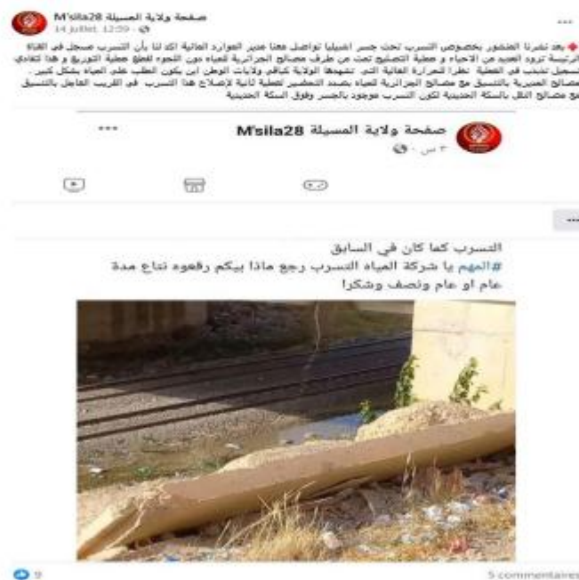
Figure 5 : publication du 14 juillet 2023.

Les internautes tentent de donner des procédures et des attitudes à prendre pour dénoncer des comportements qu'ils jugent illégaux. En donnant une voix aux habitants, ces conversations contribuent à la construction d'une identité urbaine et à la consolidation du sentiment d'appartenance à la communauté de M'sila. Elles permettent également de sensibiliser et de mobiliser les autorités locales, les responsables et les décideurs sur les questions qui touchent directement la vie quotidienne des habitants. Les discours sur Facebook contribuent donc à modifier la ville en changeant certaines réalités négatives. En effet, « les possibilités qu'offrent les réseaux numériques aux internautes leur permettent de se situer dans un système d'énonciation nouveau qui leur permet à la fois d'enrichir les publications à travers leurs commentaires ou les échanges qu'ils peuvent avoir avec les autres abonnés de la même page » (Zaghba, 2020 : 39)