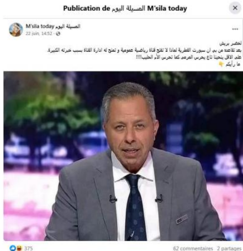
Figure 1 : Publication du 22 juin 2023 à 14h52

Lorsque la réponse du locuteur en cours (LC) ne correspond pas aux caractéristiques du locuteur suivant (LS), des situations conflictuelles peuvent survenir. Nous avons observé que dans de telles situations, le LC intervient pour répondre au LS ou pour apporter des éclaircissements sur sa publication. Comme est le cas des réponses à cette publication :