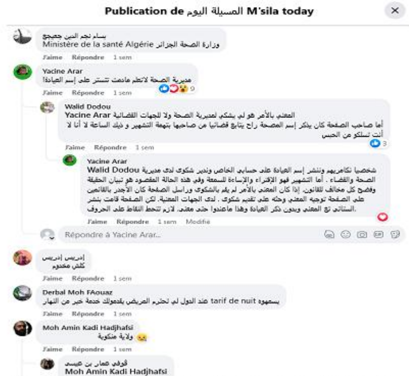
Figure 4 : commentaires de la publication du 4 juillet 20h 40.

Les conversations sur ces pages Facebook deviennent ainsi un espace de débat, de partage d'informations et de mobilisation citoyenne, tout simplement un espace de mise en mots de la ville. Les habitants peuvent exprimer leurs préoccupations, demander des solutions, partager des expériences et proposer des initiatives. Ces échanges participent à la construction d'une conscience collective, où les problèmes urbains sont discutés, analysés et confrontés aux idées et aux suggestions des interlocuteurs. Ainsi dans les interactions suivantes :