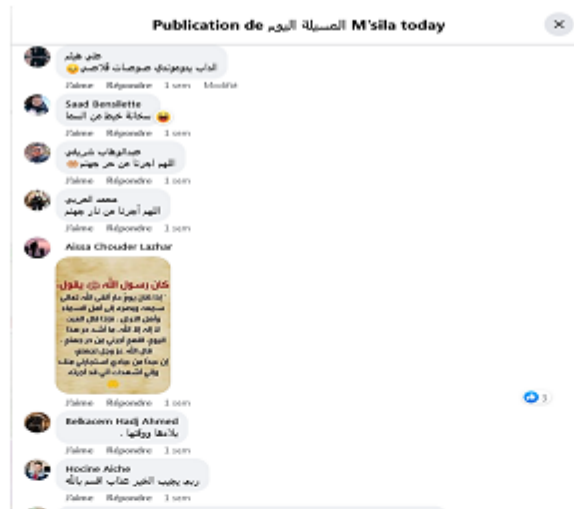
Figure 2 (suite) de la publication du 7 juillet 2023.

Le LC initie la conversation en citant une phrase d'un humoriste algérien Fethi Boukhari 1 . A1, qui possède une bonne connaissance du monde auquel l'énoncé renvoie, répondra en relation avec le sketch en question. Cependant, les autres abonnés réagissent de manières différentes à la publication : certains expriment des prières, d'autres expriment leur approbation, tandis que d'autres, comme A11 : الداب ايدموندي سوسات قلاصي (traduction littérale : l'âne commande une sucette glacée), plus créatifs, proposent des énoncés humoristiques similaires à celui du LC.