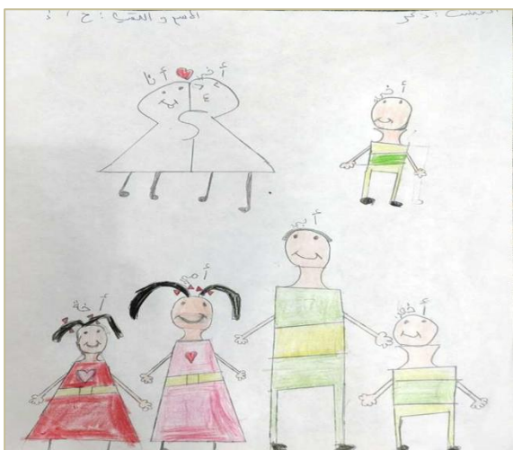
Cas 1 – Enfant victime de conflits parentaux