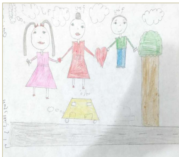
Cas 2 – Enfant victime du divorce parental