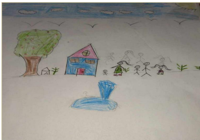
Cas 4 – Enfant orpheline de père